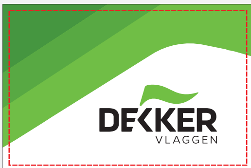
3 cm rondom vrijhouden van logo/teksten